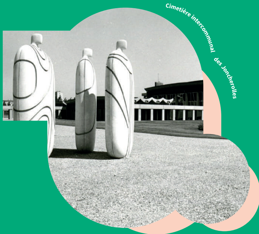
Cimetière intercommunal des Joncherolles

Un florilège de rendez-vous à ne pas manquer dans les villes du territoire.