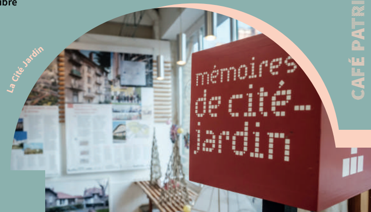
La Cité Jardin

Lieu de rendez-vous : Mémoires de cité-jardin - 28 avenue Paul Vaillant Couturier Accès libre