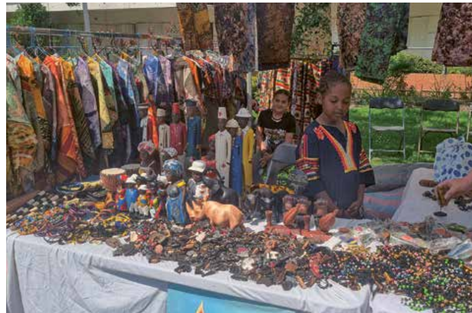
Le stand de l'association durant la Foire au Chocolat du 25 mai, dans le jardin Baldaccini.

L'association encourage également la pratique du sport, en particulier chez les enfants, avec des activités comme le teck-ballon. Le 9 mai dernier, une dizaine d'enfants ont notamment pris part à la Foulée Pierrefittoise, où l'un de nos jeunes coureurs a décroché la première place. Pour les adultes, Villeta'ZAMI propose des cours de danse, baptisés « Danse avec Penda », visant à combattre la sédentarité. Des marches sont