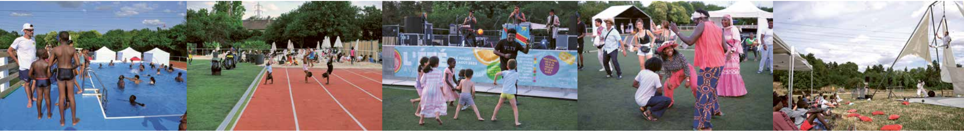
Éventail des activités et animations proposées lors de l'édition précédente

En dehors des activités prévues sur site, les services sont mobilisés pour vous proposer des activités pensées spécialement pour tous les publics : renforcement musculaire pour nos aînés, théâtre pour les tout-petits, tournoi de sport, concerts, ciné en plein air... à partir du 14 juillet et jusqu'au 10 août, de 14h à 20h30 du lundi au jeudi, le stade Bernard Lama se transformera en une base de loisirs géante pour toute la famille. Voici un petit aperçu de ce qui vous attend.