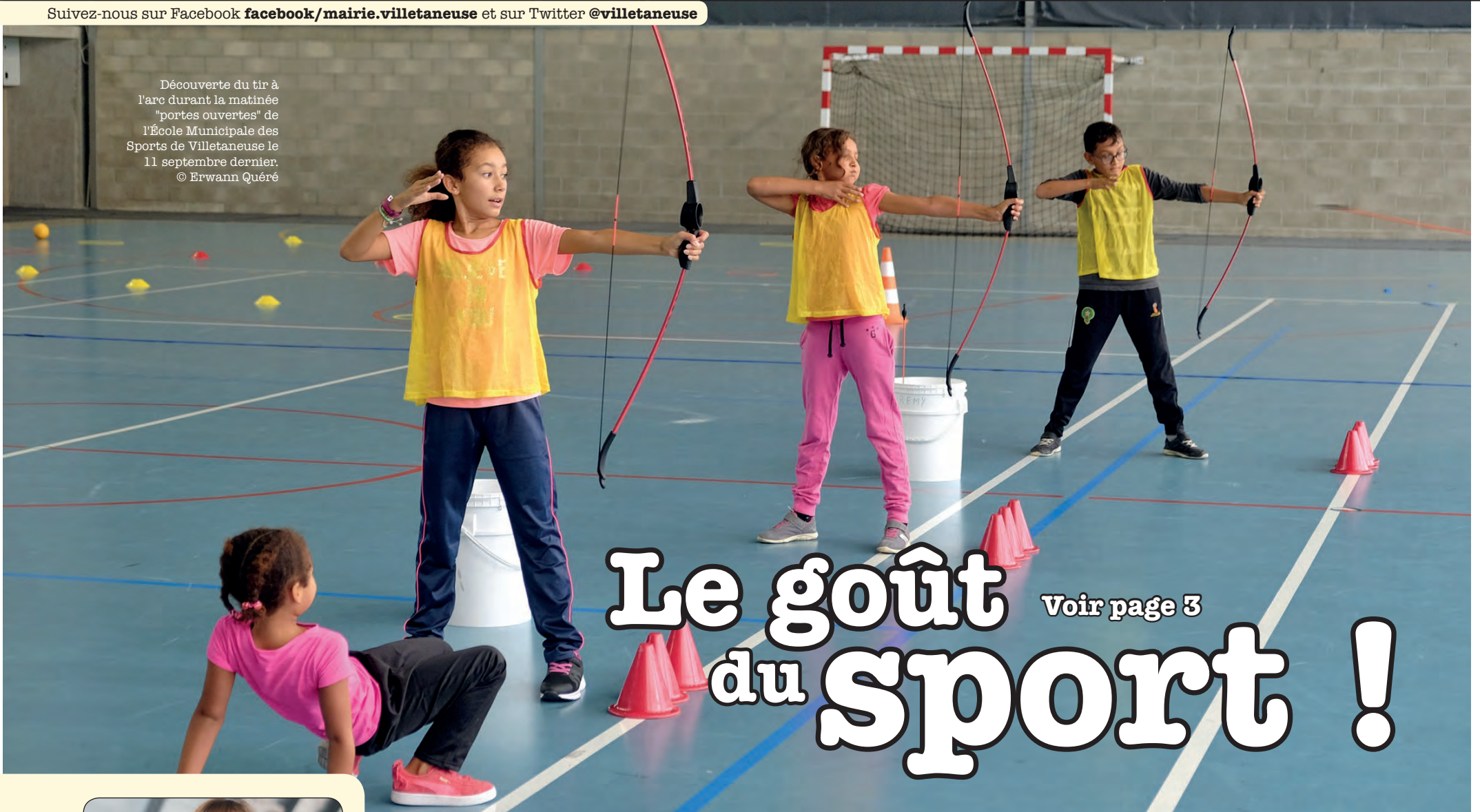
Découverte du tir à l'arc durant la matinée "portes ouvertes" de l'École Municipale des Sports de Villetaneuse le 11 septembre dernier.

Suivez-nous sur Facebook facebook/mairie.villetaneuse et sur Twitter @villetaneuse