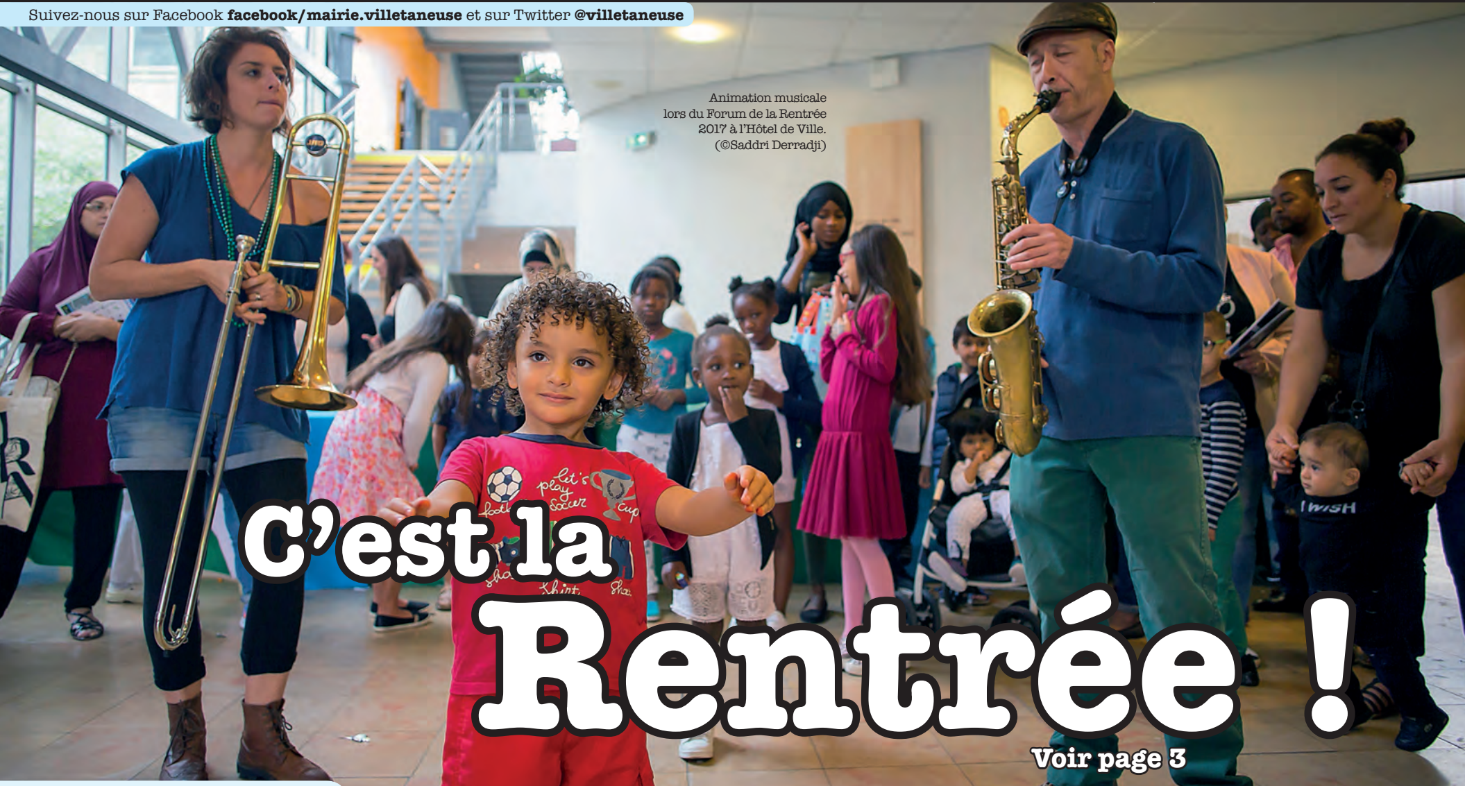
Animation musicale lors du Forum de la Rentrée 2017 à l'Hôtel de Ville.

Suivez-nous sur Facebook facebook/mairie.villetaneuse et sur Twitter @villetaneuse