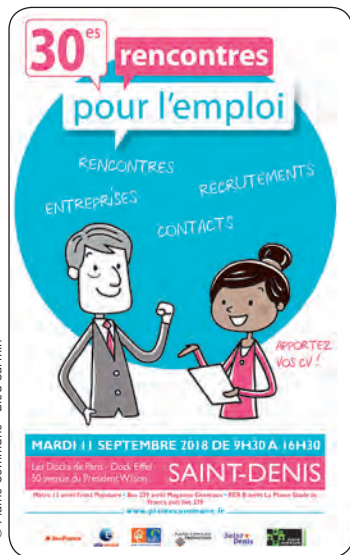
© Plaine Commune - Bleu Carmin

30 ES RENCONTRES POUR L'EMPLOI MARDI 11 SEPTEMBRE DE 9H30 À 16H30 À SAINT-DENIS