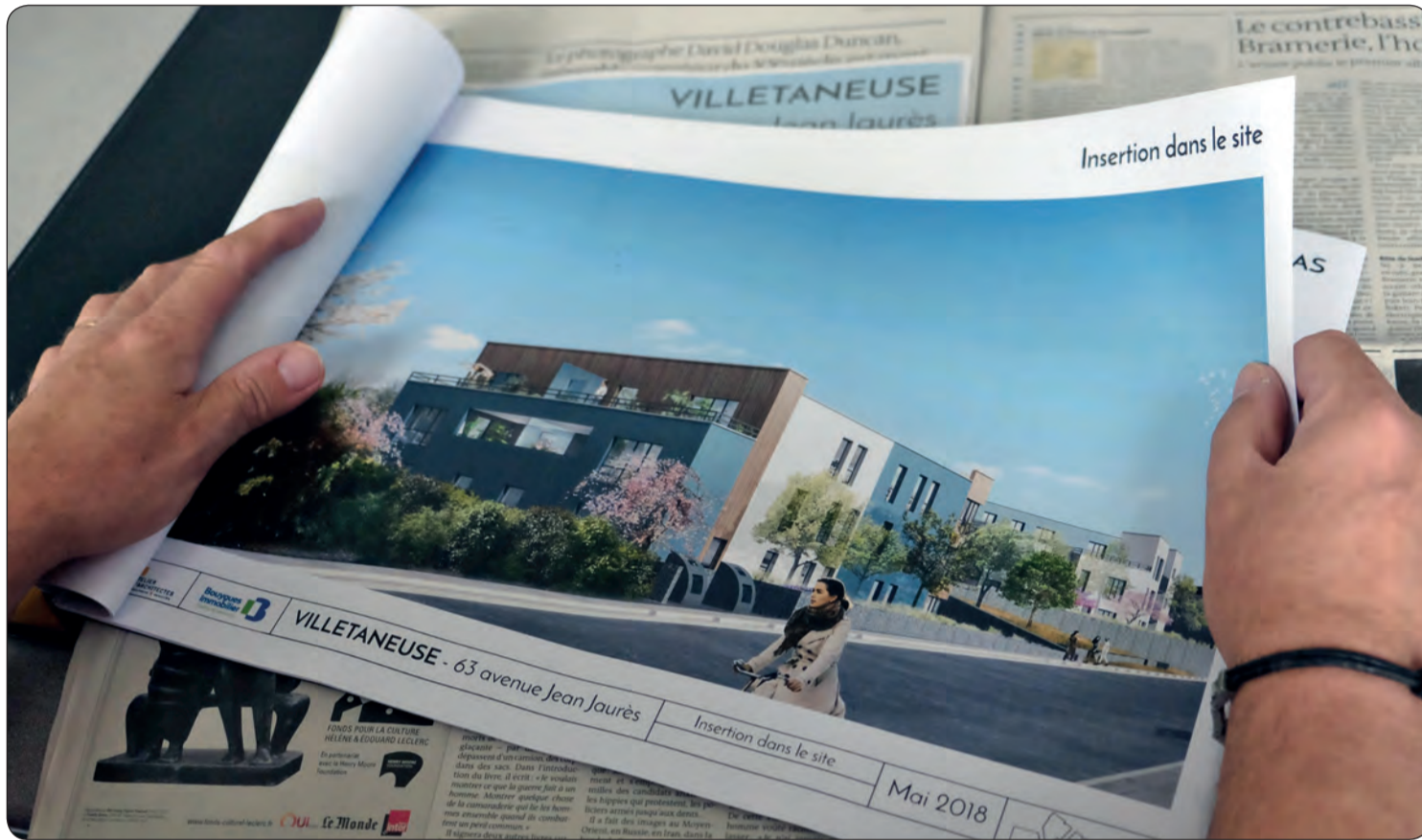
Une perspective du programme de construction consultée lors de la rencontre avec les riverains.

Le développement de Villetaneuse, encadré par le Plan Local d'Urbanisme, prévoit à l'horizon 2030, deux mille habitants supplémentaires. Pour cela, la construction de nouveaux logements est primordiale. Plusieurs programmes de constructions s'étaleront au fil des ans. Un premier projet a été présenté aux riverains du sentier des moutonnes, jeudi 7 juin. Il s'agit d'un programme de construction de 49 logements en accession à la propriété.