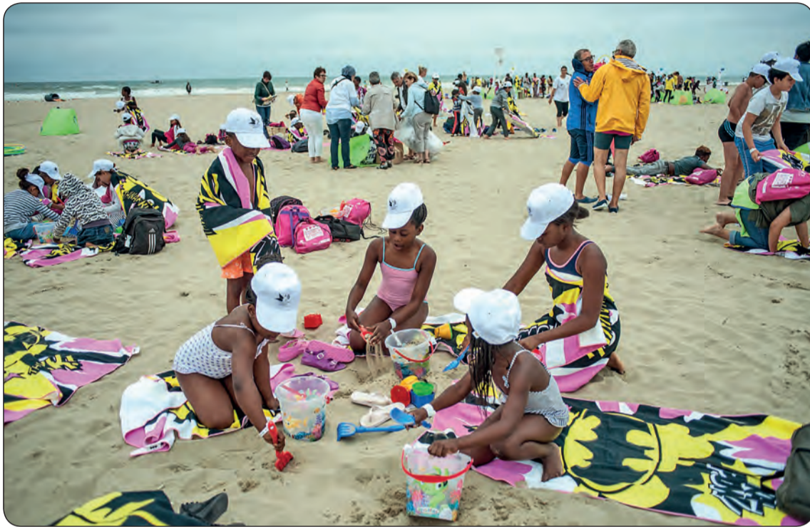
23 août 2017, la Journée des oubliés des vacances (JOV), organisée par le Secours Populaire : près de 6000 enfants de la région parisienne ont passé une journée sur la plage de Deauville.

C'est avec cet esprit que le Secours Populaire de Villetaneuse organise, comme chaque année, plusieurs initiatives estivales en direction d'une dizaine de jeunes