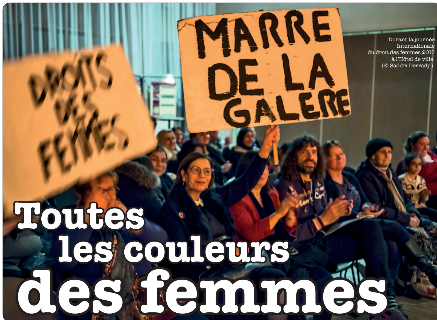
Durant la journée Internationale du droit des femmes 2017 à l'Hôtel de ville.