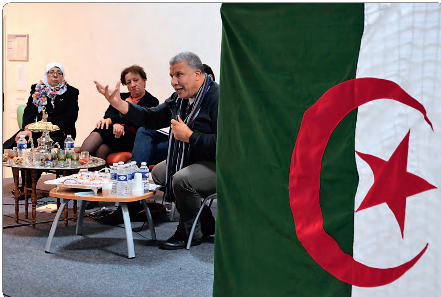
Durant la soirée mémorielle organisée l'an dernier au centre socioculturel.

Le 17 octobre 1961 est un moment oublié de l'histoire de France. Longtemps, les atrocités commises pendant cette manifestation pacifique d'Algériens ont été passées sous silence par le gouvernement et les médias français. La Ville vous invite à une soirée dédiée à la mémoire et au débat le jeudi 19 octobre à partir de 18h15 au centre socioculturel Clara Zetkin.