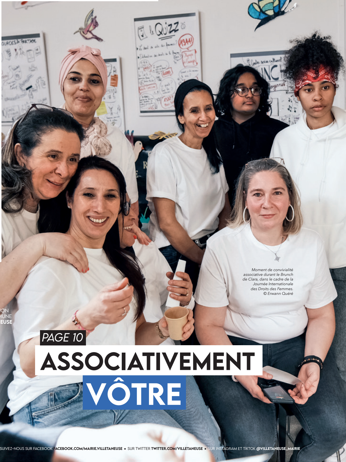
Moment de convivialité associative durant le Brunch de Clara, dans le cadre de la Journée Internationale des Droits des Femmes.

MAGAZINE D'INFORMATION DE LA COMMUNE DE VILLETANEUSE