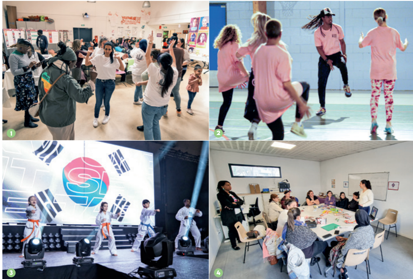
1 Le Brunch de Clara : un grand moment de convivialité associative.

Elles sont une force pour la commune. Dynamiques, volontaires, les associations villetaneusiennes forment ensemble un tissu dense qui vient quotidiennement en aide aux administrés, qu'ils soient dans des situations fragiles, seuls, ou tout simplement à la recherche de lien social. Toutes s'inscrivent dans un élan de solidarité admirable, qui fait la fierté de la municipalité. Focus.