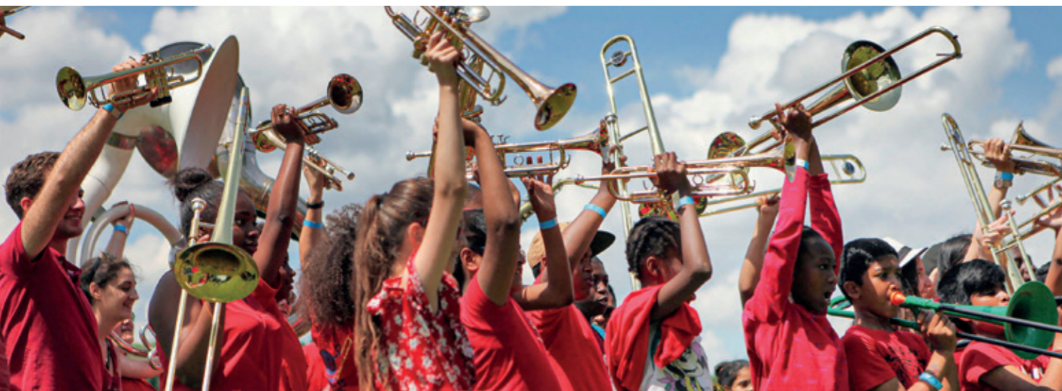
Ci-dessus, le Fire Brass Band en représentation.

Après 3 ans sans fête de la ville, la Municipalité a souhaité relancer cet événement fédérateur en renouvelant le genre. Le samedi 13 mai, ce moment festif prendra la forme d'un carnaval, le premier du genre à Villetaneuse. Préparez-vous à déambuler dans les rues de la commune aux couleurs du monde, aux sons des cuivres des brass band et aux rythmes des percussions caribéennes !