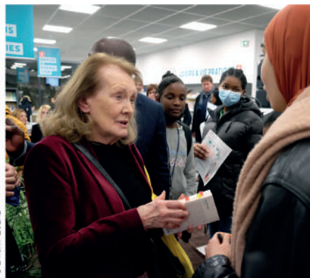
Annie ERNAUX en pleine dédicace durant l'inauguration de la médiathèque en mars 2022.

A nnie ERNAUX a reçu le prix Nobel de Littérature le 6 octobre dernier. L'Académie suédoise a souhaité saluer l'ensemble de son œuvre et en particulier le traitement qu'elle fait de la « mémoire ».