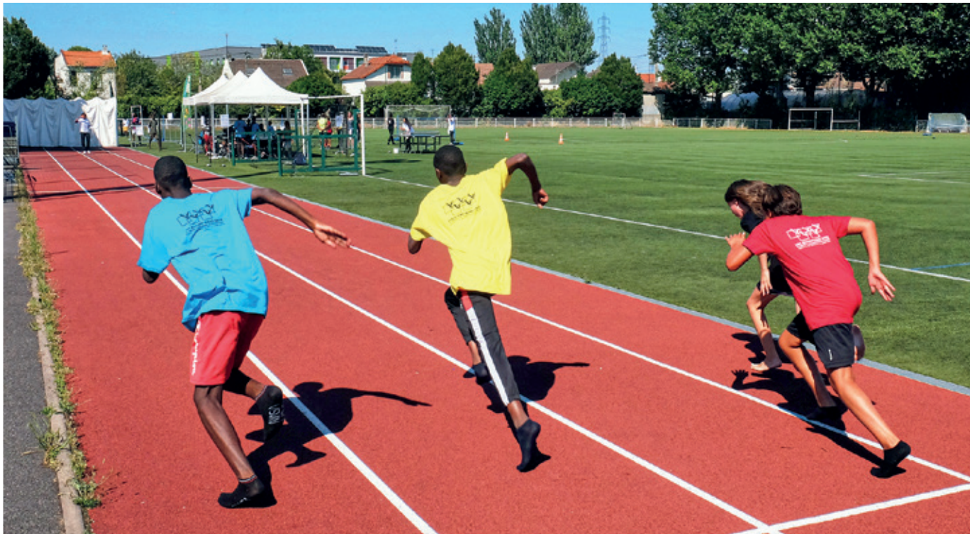
Epreuve de vitesse durant les Olympiades organisées par le Conseil Municipal de la Jeunesse lors de «L'été à Villetaneuse» 2022.

Saviez-vous qu'à Villetaneuse, 50 % de la population a moins de 30 ans ? Et oui, Villetaneuse est résolument jeune ! Et, parce que cette jeunesse a, elle aussi, droit à la parole, la municipalité a instauré en novembre 2021 le Conseil des Jeunes (CDJ), qui clôturera son premier mandat dans quelques semaines. Focus.