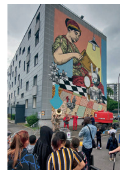
PRINTEMPS DU STREET ART

Le carnaval de Villetaneuse en fête : une première réussie. En ce printemps capricieux, le soleil nous a fait l'honneur de sa présence tout au long de cette journée festive. Le défilé du carnaval s'est élancé sous les percussions du Mas an Ba Fey, les rythmes de New Orleans des Fire Brass Band, de l'orchestre Demos et du CICA, en marquant des arrêts « FlashMob » pour danser sur la musique de Beyoncé. Les Drôles de marionnettes géantes de la Cie Courant d'Art Frais dominaient tout le cortège constitué de plusieurs centaines de personnes. De retour au village carnavalesque, les familles ont pu se restaurer, profiter du soleil, des stands de jeux pour les enfants. Un vrai bonheur de pouvoir à nouveau se retrouver après plusieurs années sans fête de la ville et belle première réussie pour ce carnaval inédit à Villetaneuse.