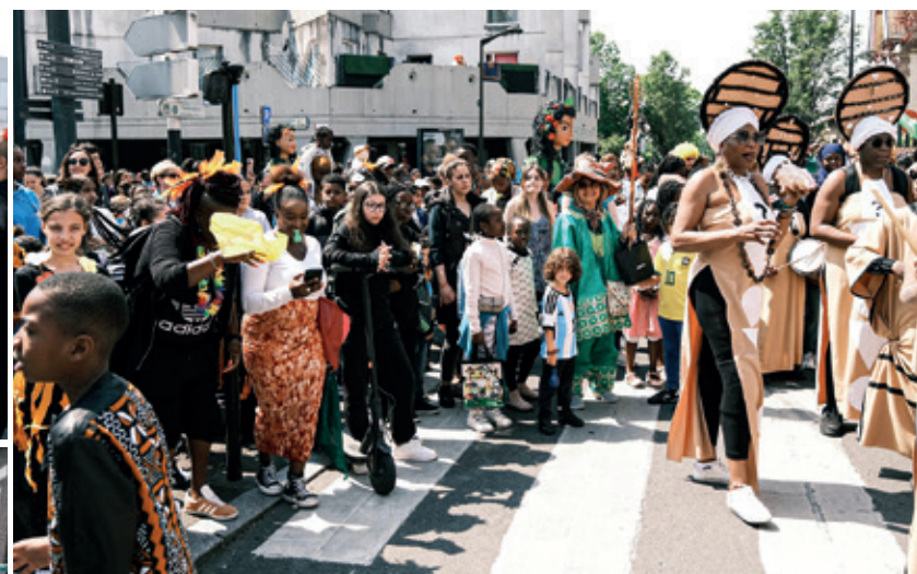
UN CARNAVAL AUX COULEURS DU MONDE

Le carnaval de Villetaneuse en fête : une première réussie. En ce printemps capricieux, le soleil nous a fait l'honneur de sa présence tout au long de cette journée festive. Le défilé du carnaval s'est élancé sous les percussions du Mas an Ba Fey, les rythmes de New Orleans des Fire Brass Band, de l'orchestre Demos et du CICA, en marquant des arrêts « FlashMob » pour danser sur la musique de Beyoncé. Les Drôles de marionnettes géantes de la Cie Courant d'Art Frais dominaient tout le cortège constitué de plusieurs centaines de personnes. De retour au village carnavalesque, les familles ont pu se restaurer, profiter du soleil, des stands de jeux pour les enfants. Un vrai bonheur de pouvoir à nouveau se retrouver après plusieurs années sans fête de la ville et belle première réussie pour ce carnaval inédit à Villetaneuse.