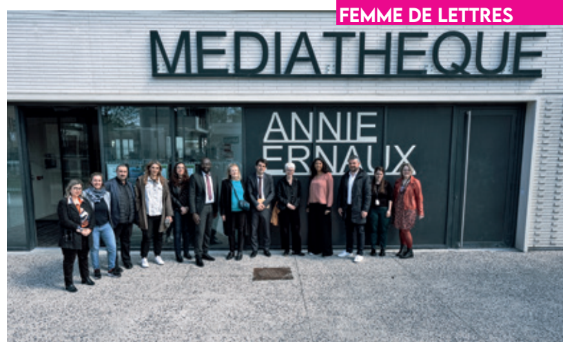
FEMME DE LETTRES

Annie Ernaux, prix Nobel de Littérature, est revenue à Villetaneuse le 19 avril pour l'inauguration du lettrage en façade de la médiathèque de Villetaneuse qui porte son nom. Une plaque apposée à l'intérieur a aussi été dévoilée, qui rend hommage à sa présence lors de l'inauguration le 8 mars 2022. Une inauguration suivie d'un débat-échanges à l'auditorium et également de nombreux invités institutionnels, notamment Monsieur le Maire et Mathieu Hanotin, président de Plaine Commune.