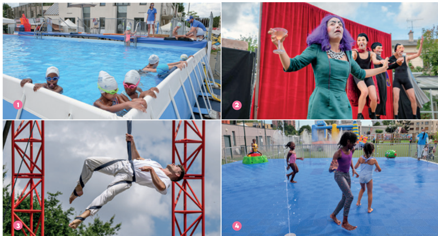
1 Pour la troisième année consécutive, un bassin d'apprentissage de la natation sera présent sur le site de l'Été à Villetaneuse, en partenariat avec Paris 2024 et la Fédération Française de Natation.

L'été arrive, et avec lui vient une multitude d'animations estivales spécialement conçues pour divertir toute la famille et souvent inédites. Au cœur de ces festivités, du 8 juillet au 5 août 2023, le stade Bernard-Lama va se transformer en un lieu magique où petits et grands profiteront d'une grande variété d'activités. Des grands jeux gonflables au théâtre en passant par des animations sportives, le bassin de nage, des spectacles circassiens, des concerts et des nocturnes, nous vous dévoilons les nombreuses surprises qui vous attendent.