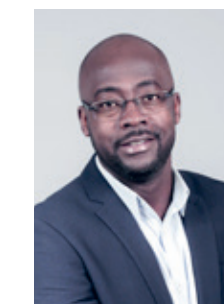
DIEUNOR EXCELLENT, MAIRE

Interview à retrouver sur le site de la Ville