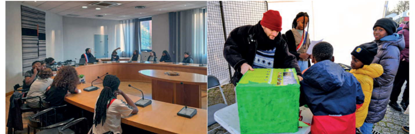
Comme leurs pairs du Conseil municipal, les membres du Conseil des Jeunes se réunissent régulièrement pour décider de leurs actions.

Le Conseil des Jeunes est aussi un lieu d'apprentissage où est donné aux jeunes la possibilité de construire des projets dans l'intérêt général et de participer aux manifestations organisées par la Ville. Véritable traduction d'un besoin de parole essentiel, le CDJ permet également